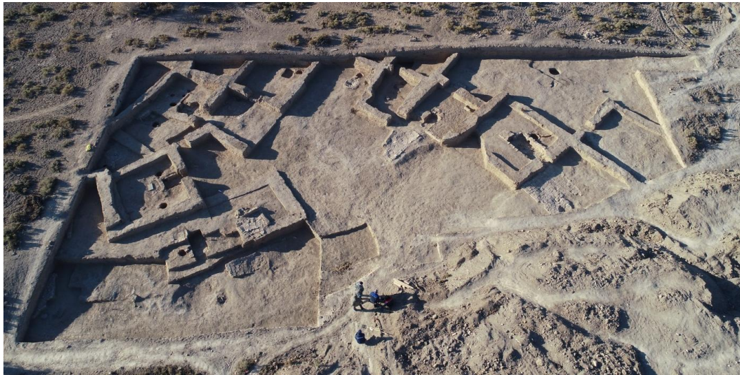
6-сурет – Сығанақ қалашығындағы №20 қазба орнының әуеден көрінісі

Екінші құрылыс қабатына жататын тұрғын үй бөлмелерінің едендерін тазалау барысында тар ауызды құмыралар, кеселер, қайрақ тастар және үш дана күміс теңгелер алынды. Саздан жасалған ыдыстар сырлы және сызсыз болып келуде. Сырлы ыдыстардың негізгі бөлігі ақшыл және ашық көкшіл түсті сырға көк және қоңыр түсті сырмен гүл дестелері және толқын іспеттес бейнелер түсірілген, кейбір ыдыстар көкшіл түспен толықтай көмерілген, ыдыстардың басым көпшілігі шыңылтырланған. Сырсыз ыдыстарға келер болсақ, ыйық тұсынан төмен қарай қызыл ангоп ағызылған. Ауыз ернену немесе ыйық тұсынан төмен қарай ағызылған ангоптарды зерттеуші ғалымдар берекенің символы ретінде қарастырады. Яғни, ыдыстан берекенің асып тасып жатқандығы бейнелеген болуы мүмкін деген тұжырым қалыптасқан. Аталмыш саз ыдыстардың үлгілері Отырар, Күлтөбе және Түркістан қалаларының XVII-XVIII ғасырларға жататын құрылыс қабаттарынан табылған (Акишев, Байпаков, Ерзакович, 1981: 1-4; Хазбулатов, Петров, Шайгозова, Ержігітова, 2020: 73-105; Туякбаев, Егеубаева, 2018: 132-133). Сонымен қатар, аталмыш құрылыс қабатынан мыс және күмістен соғылған теңгелер табылды.