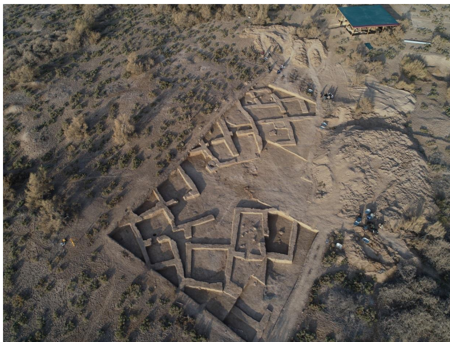
4-сурет – Сығанақ қалашығындағы №20 қазба орнының әуеден көрінісі