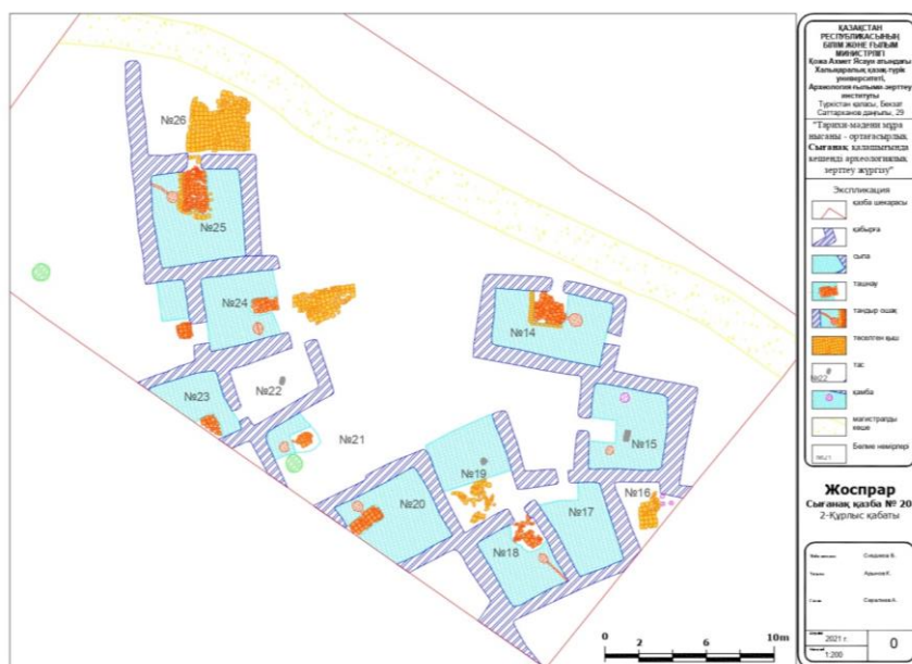
7-сурет – Сызанақ қалашығындағы №20 қазба орнындағы екінші құрылыс қабатының жоспары

Екінші құрылыс қабатының хронологиясын анықтау мақсатында саздан жасалған ыдыстарға салыстырмалы талдау жұмыстары жүргізілді. Нәтижесінде аталмыш құрылыс қабатының XVIII ғасырға жататындығы анықталды. Салыстырмалы талдау жұмыстарының нәтижесіне сүйене отырып, Шайбанидтер әулетінің билеушісі II Абдулла ханның билігі тұсында (1557-1598 жж) соғылған күміс теңгелердің Сызанақ қаласында XVIII ғасырда қолданыста болғандығын айта аламыз. Сонымен қатар, Сызанақ қаласының XVII-XVIII ғасырдағы тұрғын үйлердің архитектуралық ерекшеліктері анықталды. Бірнеше бөлмеден тұратын анфиладты жоспар түрінде салынған тұрғын үйлер және «П» іспеттес сыпалардың алғашқы үлгілері ортағасырлық Отырар, Түркістан және т.б. қалалардың XI-XII ғасырларға жататын құрылыс қабаттарынан анықталған (Байпаков, 2007: 82-83). Бұл зерттеуде, Сызанақ қаласында анықталған бір, екі немесе үш бөлмеден тұратын анфиладты және «Г» іспеттес жоспар түрінде салынған тұрғын үйлердің және жатын бөлмелерінен анықталған «П» іспеттес сыпалардың, есік аузының астында ташнауы бар кірпіш төсенді едендердің және бөлме жылытуға арналған түтіндігі сыпатын астымен жүргізілген тандыр ошақтардың XVIII ғасырда да қолданыста болғандығы көрініп отыр.