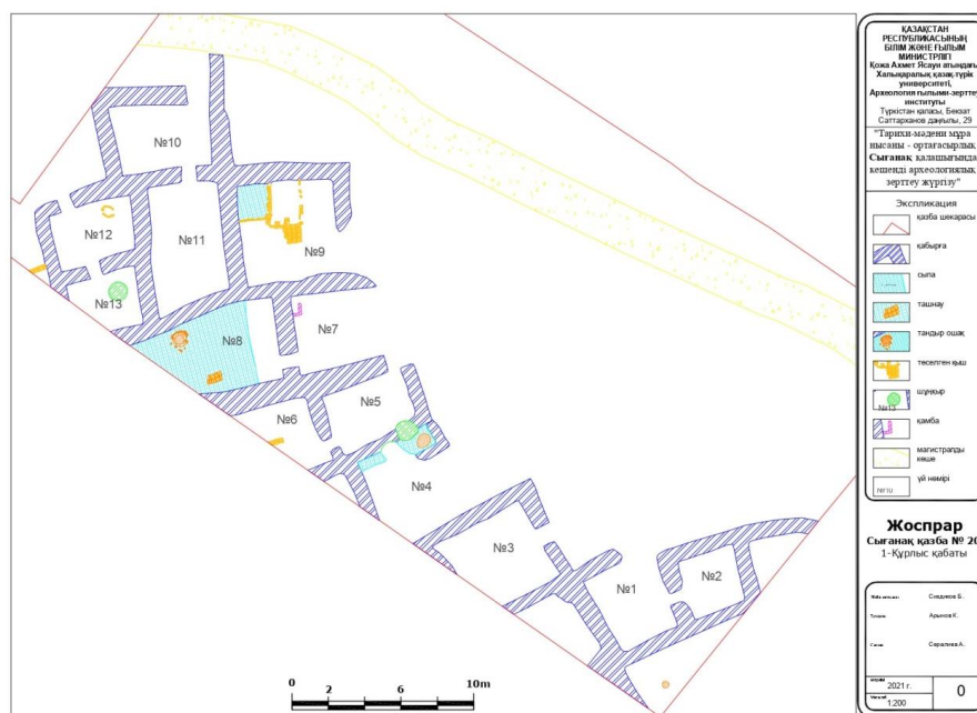
5-сурет – Сығанақ қалашығындағы №20 қазба орнындағы бірінші құрылыс қабатының жоспары

Далалық зерттеу жұмыстары барысында, жердің беткі қабатынан 0,7 м – 1,3 м тереңдіктен екінші құрылыс қабаты анықталды. Құрылыстарды аршу барысында кейбір үйлердің үстіне уақыт өте келе (мысалға кейбір бірінші құрылыс қабатындағы бөлмелер екінші құрылыс қабатындағы бөлмелердің үстіне тұрғызылған) алғашқы жоспар бойынша бөлме тұрғызылғандығы белгілі болды. Аталмыш құрылыс қабатына тиесілі он үш бөлме, екі бастырма және екі аула ашылып, толық сипаттамасы жасалынып, бөлмелердің қандай мақсатта пайдаланғандығы жөнінде ғылыми тұжырымдар жасалынды (6-сурет).