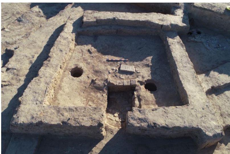
8-сурет – Сығанақ қалашығындағы №20 қазба орнынан анықталған жатын бөлмесінің көрінісі

Археологиялық қазба жұмысы барысында бірінші және екінші құрылыс қабаттарына тиесілі бөлмелер мен аулалардан ірілі-ұсақты мал сүйектері толық алынып, алынған жеріне байланысты жеке-жеке топтастырылды. Алынған остеологиялық материалдарға А.Х. Марғұлан Атындағы Археология Институтының «Археологиялық технология» зертханасында сараптама жасалынууда. Сараптама нәтижесінде XVII-XVIII ғасырларда қалашық тұрғындарының қолға үйреткен жануарларының түрлері анықталады. Екінші құрылыс қабатының абсолюттік хронологиясын анықтау мақсатында ағаш шіріндісінен, жартылай жанған ағаш және шөп қалдықтарынан, қамба орындарынан C14 анализі үшін сынама алынды. Алынған сынамаларға Түркия Республикасындағы «ТУБИТАК МАРМАРА» зертханасында сараптама жасалынууда. Сараптама нәтижесінде екінші құрылыс қабатының нақты абсолюттік хронологиясы анықталады. Сонымен қатар, бірінші және екінші құрылыс қабаттарынан алынған саздан жасалған ыдыстардың құрамын, жасалу технологиясын анықтау мақсатында Түркия Республикасындағы «REDEVIO AR-GE Bilgi ve Operasyon Teknolojileri» зертханасында сараптама жасалынууда. Атқарылып жатқан ғылыми-зерттеу жұмыстарының барлығы қалашықтың Қазақ хандығы тұсынағы тарихы жайында құнды деректер жинақтап, ғылыми айналымға енгізуге бағытталған.