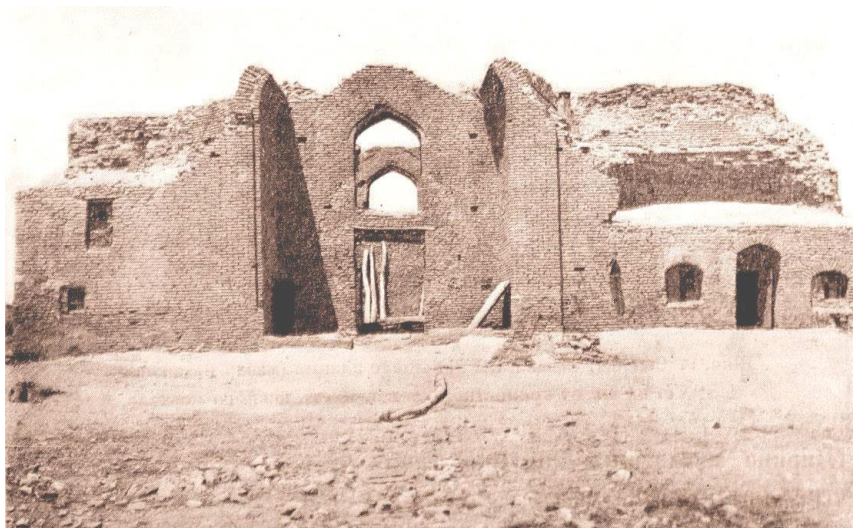
3-сурет – Мешиттің (ханака) 1927 жылғы суреті (Якубовский, 1929: 145)

XX ғасырдың 70-ші жылдары Отырар археологиялық экспедициясының меңгерушісі К.А. Акишев пен К.М. Байпақовтар Сығанақ қалашығының орнында болып, қалашықты топографиялық жағынан зерттеп, нәтижесінде бұл ескерткішті ортағасырлық қалалардың ішінде Отырар қаласынан кейінгі атақты екінші қала деген анықтама береді (Акишев, Байпаков, Ерзакович, 1970).