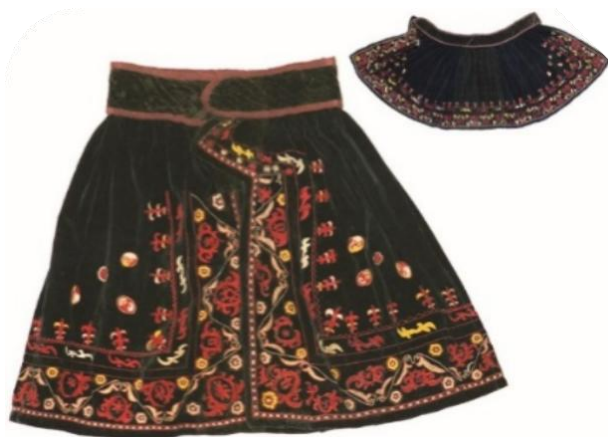
Рис 17. Белдемше . Женская поясная распашная одежда. Западный Жетысу. Нач. XX в. ЦГМ РК. КП 602

Существовали два типа белдемше . Первый кроился из трапецевидных, расширяющихся книзу полотнищ. Второй – из прямоугольных полотнищ, собранных у пояса [Захарова, Ходжаева, 1964: 98–102]. Белдемше первого типа шили из нескольких раскошенных книзу кусков ткани. Собранная из таких кусков «юбка» пришивалась сборами к широкому (до 9 см) поясу из тонкого войлока, обшитого тканью, затем простроченного. Последняя операция, очевидно, производилась для придания жесткости поясной части одежды. Белдемше шили из плотных тканей темных тонов, с шерстяной простроченной подкладкой. Встречались зимние типы белдемше из крытого тканью тонкого войлока, жабагы и овчины [Катанаев, 1983: 28]. Нарядные белдемше шили из дорогих тканей черных и красных цветов различных оттенков (сукно, шелк, бархат и др.). В старину белдемше входил в состав приданного невесты. Белдемше как один из видов старинной одежды имел и ритуальное значение. В историческом прошлом молодая замужняя женщина в момент наступления новой семейной жизни в присутствии близких родственниц и соседок по аулу была обязана совершить обряд одевания белдемше . Ритуал завершался обильным угощением приглашенных [Әлімбай, Қақабаев, 2017. 1-т. 632–633]. Вероятно, в данном случае это действие следует рассматривать как обряд инициации. Он означает «официальный» переход этой самой молодой женщины к категории потенциальных рожениц.