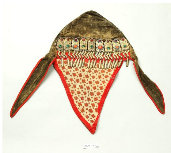
Рис 8. Зере – шапочка надеваемая под сәукеле . Середина XIX в. Сырдарьинский регион. РЭМ. Инв. № 8763-612/1,2

В историко-этнографическом прошлом родители невесты заказывали сәукеле специальным мастером. Он обходился очень дорого, порой цена доходила 2–3 тыс. рублей серебром [Казахи, 1995: 155]. Обычно под названием сәукеле подразумевался весь комплекс головного убора невесты. Следующая часть комплекса зере , представляет собой простёгнутую плотными стежками нижнюю шапочку конической формы, на которую надевалась сәукеле ) [Рис. 8]. Зере имела две боковые лопасти ( құлақ , жақтама ) и назатыльник ( желке , желкелік ). Некоторые зере по нижнему краю имели меховую опушку. Для придания устойчивости на голове с боковых сторон зере нашивали подвязки ( тамақбау ), которые завязывались под подбородком [Шойбеков, 2017: 49–50 б].