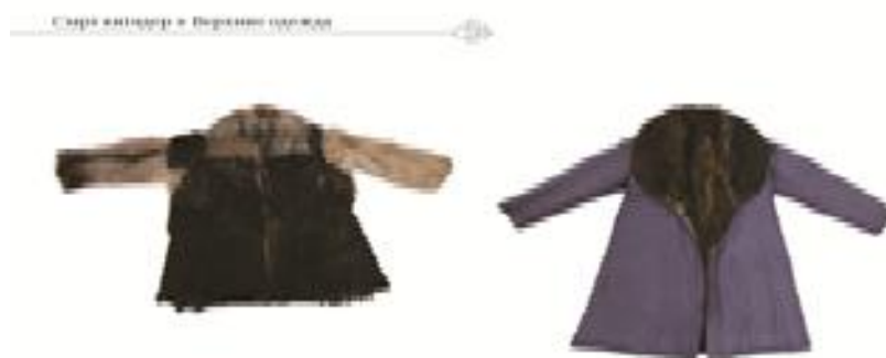
Рис. 14. Доха ( дақы ). Из козьей шкуры черного цвета, мехом вверх. Подкладка из черной хлопчатобумажной ткани. Большой отложной воротник. ЦГМ РК КП 26300

Демисезонные виды. Среди предназначенной для ношения преимущественно в осенне-весеннее межсезонье традиционной верхней одежды особняком стоит жарғақ , именуемый также жақы . По покрою также относится к группе распашной плечевой одежды. Его шили из выделанных гладких шкур жеребят, стригунков и сайги мехом наружу. При этом изготовленный из шкур, преимущественно павших в весенний период жеребят, данный вид одежды назывался құлын жарғақ . Особо ценились құлын жарғақ из шкур вороных жеребят, называемые мақпалқара жарғақ . Из шкур подросших жеребят (до годовалого возраста) шили тайтері и тайжақы. Құлын жарғақ кроилась таким образом, что грива располагалась вдоль рукавов с внешней стороны и вдоль спины по середине [Жарғақ/Жарғақ тон, 2017: 351].