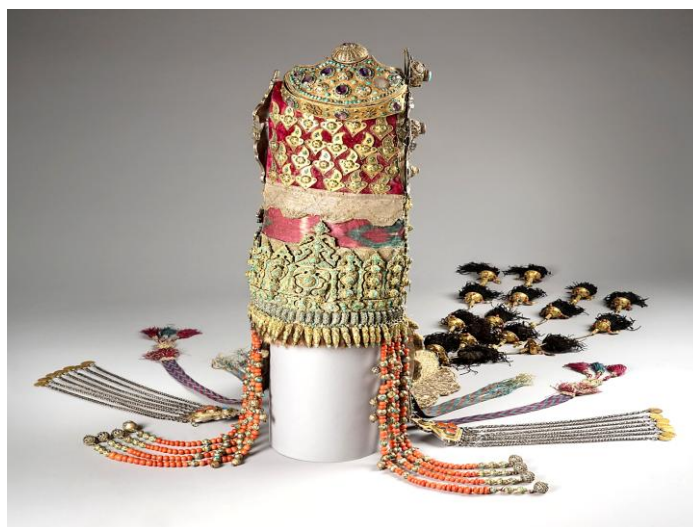
Рис. 7. Сәукеле . Середина XIX в. Западный Казахстан. РЭМ. Инв. №215-1

декорировали златотканной вышивкой, кораллом, бирюзой, сердоликом, жемчугом, бусами, бисером, галуном, пайетками, серебряными бляшками, монетами и т.д. С боков прикреплялись подвески из нитей коралла, серебряных цепочек, шелковых шнуров с кистями, доходящими до пояса ( жақтау ). Нижнюю часть сәукеле оторачивали мехом выдры или бобра. В данном случае декоративные элементы меха, помимо эстетической функции, вкпе с такими полудрагоценными камнями, как сердолик и бирюза, выполняли и функции защиты невесты от негативного воздействия злых намерений, сглаза, зависти и т.д. [Крюкова, 2006: 148–159]. Богатые сәукеле кроме указанных декоративных элементов, украшались и золотыми бляшками, нередко нашивались золотые монеты [Стасевич, 2023: 108–112]