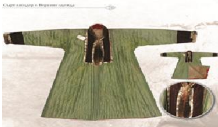
Рис. 13. Күпі (шуба) женская. Южно-Казахстанская обл. Нач. XX в. Шелк, шерсть, бархат, мех, позумент, стежка. Длина 125 см. Крыта зеленым шелком, подбита простеженной на х/б ткани овечьей шерстью бежевого цвета, стеганная насквозь по длине. Силуэт трапециевидный, расширяющийся к низу. Воротник стоячий, оторочен мехом выдры. Нагрудная часть, края рукавов отделаны бордовым бархатом, края обшиты золотистым позументом и, внутренняя сторона края подола обшита шелком красного цвета. ЦГМ РК. КП 8039

Он представляет собой особый вид распашной одежды из нашитой на тканевую основу естественным образом свойлаченной верблюжьей или овечьей шерсти ( жабагы жүн ). Простота изготовления, эффективные теплозащитные свойства способствовали широкому распространению жабагы күпі по всему Казахстану. Это обстоятельство в конечном итоге привело к формированию его как самостоятельного вида верхней одежды, принципиально отличающегося как от шубных изделий, так и от стеганных типов верхней одежды ( шапан, бешпент, күпі и т.д.) [Потапов, 1949: 66]. Характерными конструктивными особенностями жабагы күпі , помимо нашитого на тканевую основу (бидайы, астар) жабагы жүн , является тканевая подшивка шириной до 15 см с изнаночной стороны