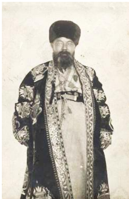
Рис. 2. Волостной управитель в үлкен шапан . Актюбинская область. Конец XIX в. Из коллекции Центрального государственного музея РК. Книга поступлений 5731 (далее – КП 5731 ЦГМ РК. КП)

по бытованию қаба шапан , заманчиво предположить его использование по крайней мере в Северном, Восточном, Центральном и Северо-Западном регионах Казахстана.