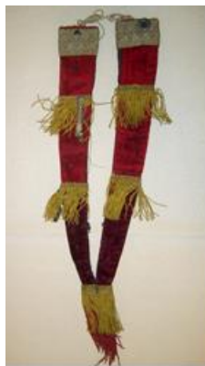
Рис. 19. Шаиқап . Начало XX в. Адаевский округ. Актюбинской губ. Из коллекции Российского этнографического музея. Инв. № 5525-16

Восточном Казахстане такого элемента женской одежды пишут и И.В. Захарова и Р.Д. Ходжаева. В процессе своих экспедиционных обследований (в течение второй половины 50–70 годов XX в.) различных регионов Казахстана им, в частности, удалось собрать уникальные этнографические сведения о таких исчезнувших предметах традиционного быта, как тізеқап (наколенники), шаиқап (накосники) и жеңсе (нарукавники). Ими производилось сравнительное изучение этих и других экспедиционно обнаруженных полевых материалов с соответствующими музейными артефактами (главным образом из коллекций РЭМ и ЦГМ Казахстана). Согласно уточненным данным, тізеқап в историческом прошлом преимущественно использовались женщинами.