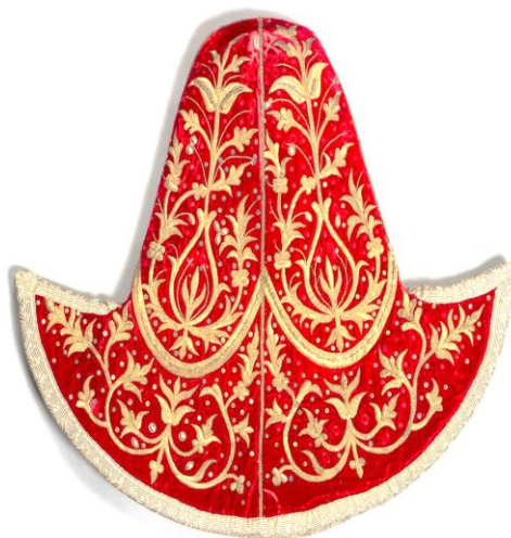
Рис 4. Головной убор мужской мұрақ . Из коллекции Российского этнографического музея (далее – РЭМ). Инв. № 8762-23540.