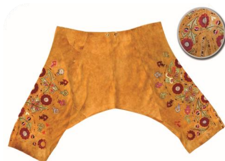
Рис 15. Штаны мужские замшевые с вышивкой. Южный Казахстан. 1886 г. (ЦГМ РК. КП 7199)

При изготовлении таких штанов по всему периметру пояса пришивалась специальная подпояска из 2-3 слоев плотной ткани, шириной примерно 4-5 см, называемая у казахов «ышқырлық». При помощи продернутого через подпояску специально подготовленного шерстяного шнура ( шалбардың бауы или дамбалбау ) одежда крепилась к талии. При верховой езде такой ышқырлық позволял заправлять верхнюю одежду в штаны [Гладышев, 1851: 68; Захарова, Ходжаева, 1964: 39–40] [Рис. 16]. Русский исследователь фон Герн по этому поводу писал: «Отправляясь на охоту, на барымту, при организованных стычках с неприятелями киргизские (казахские – авт.) джигиты полы чапана и шекпен заправляли в штаны и подпоясывались» (Фон Герн, 1898: 59).