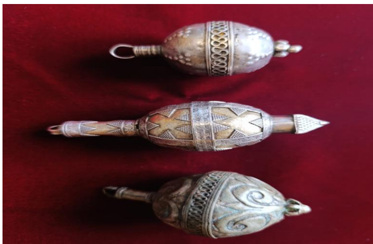
Рис 10. Типы традиционных казахских пуговиц « Торсылдақ ». Серебро, позолота, зернение (из личной коллекции автора)

Верхняя одежда. Традиционно верхняя плечевая одежда была распахной туникообразного покроя с прямым или трапецевидным силуэтом. Они шились просторными с глубоким запахом без застежек или с одной застежкой у ворота. Состав и покрой мужской и женской верхней одежды во многом были схожи. Отличия заключались в форме воротников, степени отделки и элементов декорирования женской одежды. Практически все виды верхней одежды в своем большинстве не имели застежек или застегивалась у самой шеи на одну застежку или объемную пуговицу, называемую « торсылдақ ».