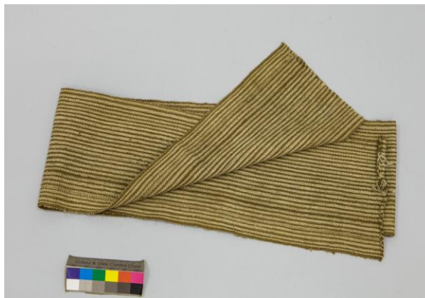
Рис. 1. Образец ткани шекпен. Лепсинский у., Семиреченская обл. Дл. 230 см, ширина 20 см. От К.Н. де Лазари, поступление 1898 г. МАЭ РАН, инв. № 410-4