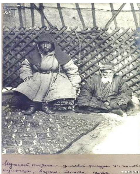
Рис 5. С. М. Дудин. Мужчина в головном уборе күләпара (фрагмент). Семипалатинская область. Оз. Саумалколь. 1899 г. Кунсткамера. Инв. № 1199-72

таких конструктивных компонентов, как тулья, боковые лопасти и назатыльники [Захарова, Ходжаева, 1989: 212–215]. Следует отметить, что в русскоязычной литературе XX в. по казахской этнографии, в том числе и такие признанные исследователи, как И.В. Захарова и Р.Д. Ходжаева иногда часто ошибочно именуют башлыком [Захарова, Ходжаева, 1989: 212–215]. На самом же деле күләпара с точки зрения жизнеобеспечивающей функции и конструктивных особенностей представляет собой совершенно самостоятельный вид головного убора. Его отличие от башлыка заключается в следующем: если куполообразная тулья күләпара плотно облегла голову, а боковые и задние лопасти практически полностью закрывали оплечье и верхнюю часть спины человека, то башлык, будучи одним из традиционных головных уборов ряда кавказских народов, представляет собой остrokонечный капюшон с узкими боковыми лопастями длиной до 1,5 м. Ими обматывались как шарфом или же обвязывались крест на крест вокруг груди человека [Военная энциклопедия, 1911: 429].