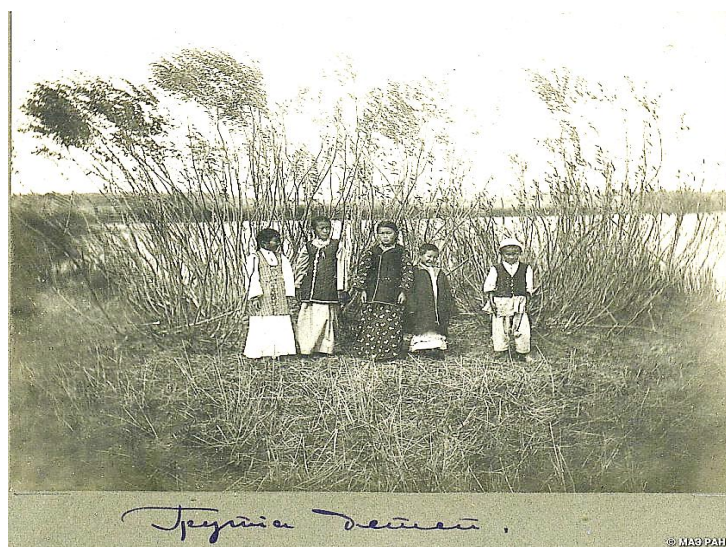
Рис 18. Группа детей. Ақмолинская обл. Нач. XX в. Фото К.В. Шенникова. Кунсткамера. Инв. № 1707-50

Детская одежда по крою и материалам не особо отличалась от одежды взрослого. Только одежда младенцев и маленьких детей имела некоторые отличия, во многом обусловленные традиционными верованиями. Обязательными в детской одежде были следующие элементы, выполнявшие функцию оберега. По традиционным поверьям казахов они были призваны защищать ребенка от сглаза ( сұқ көз, жаман көз, сұқтана қарау и т.д.) и порчи [Рис. 18].