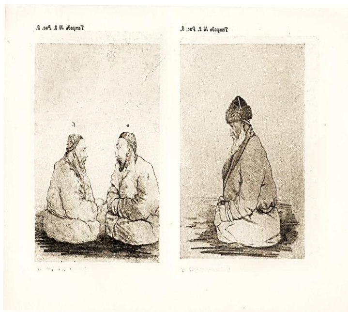
Рис 6. П.М. Кошаров. Мужчина в головном уборе – бөрік, надетый на тубетейку (Казах Большой Орды племени Дулатов. 1857 г.) (Абрамзон 1953: Рис. 8)

бөрік с более низкой тульей округлой формы [Левшин, 1832: 46–47; Солнцев, 1836; Захарова, Ходжаева, 1964: 109]. Девичьи бөрік с плоским верхом и высоким (до 10 см.) околышем из меха выдры или бобра назывались кәмшат бөрік .