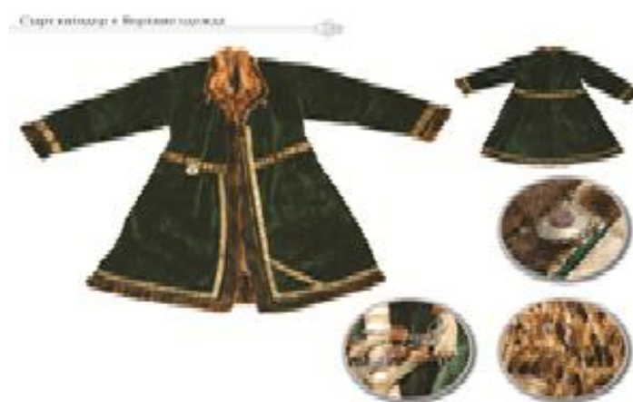
Рис. 12. Шуба ( пұшпақ ішік ) женская из лисьих лапок. Крытая зеленым бархатом, на меху с лисьих лапок. ЦГМ РК КП 14983

Состоятельные люди носили тон из волчьих и лисьих шкур. Женские тон были слегка приталены, при ношении они также подпоясывались. Бытовали женский тон и с пряжкой-застежкой на поясе. В традиционной социальной среде тон с отложными и шалевыми воротниками относились к разряду престижных видов одежды, называемых « жагалы киім » [Әлімбай, Шойбеков, 2019. 2-т. 351]. К такому типологическому ряду зимней верхней одежды следует отнести и ішік – крытую шубу из овчины, меха пушных зверей и мерлушки. Крытая шелковыми тканями, бархатом, дорогими сортами сукна, богато отделанная вышивкой, позументом, а также оторочкой бортов подола рукавов и воротников дорогими мехами ішік были символом достатка и социальной значимости. Такая одежда входила в ряд комплектов материальных ценностей, называемых у казахов киім, жасау, тоғыз, құн, бесжақсы и т.д. Особым изяществом отличались женские шубки пұшпақ ішік , сшитые из меха лапок пушных зверей [Рис. 12].