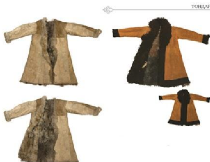
Рис 11. Сеңсең тон из дубленой овчины. Нач. XX в. Южный Казахстан. ЦГМ РК. КП 13129)

Состоятельные люди носили тон из волчьих и лисьих шкур. Женские тон были слегка приталены, при ношении они также подпоясывались. Бытовали женский тон и с пряжкой-застежкой на поясе. В традиционной социальной среде тон с отложными и шалевыми воротниками относились к разряду престижных видов одежды, называемых « жагалы киім » [Әлімбай, Шойбеков, 2019. 2-т. 351]. К такому типологическому ряду зимней верхней одежды следует отнести и ішік – крытую шубу из овчины, меха пушных зверей и мерлушки. Крытая шелковыми тканями, бархатом, дорогими сортами сукна, богато отделанная вышивкой, позументом, а также оторочкой бортов подола рукавов и воротников дорогими мехами ішік были символом достатка и социальной значимости. Такая одежда входила в ряд комплектов материальных ценностей, называемых у казахов киім, жасау, тоғыз, құн, бесжақсы и т.д. Особым изяществом отличались женские шубки пұшпақ ішік , сшитые из меха лапок пушных зверей [Рис. 12].