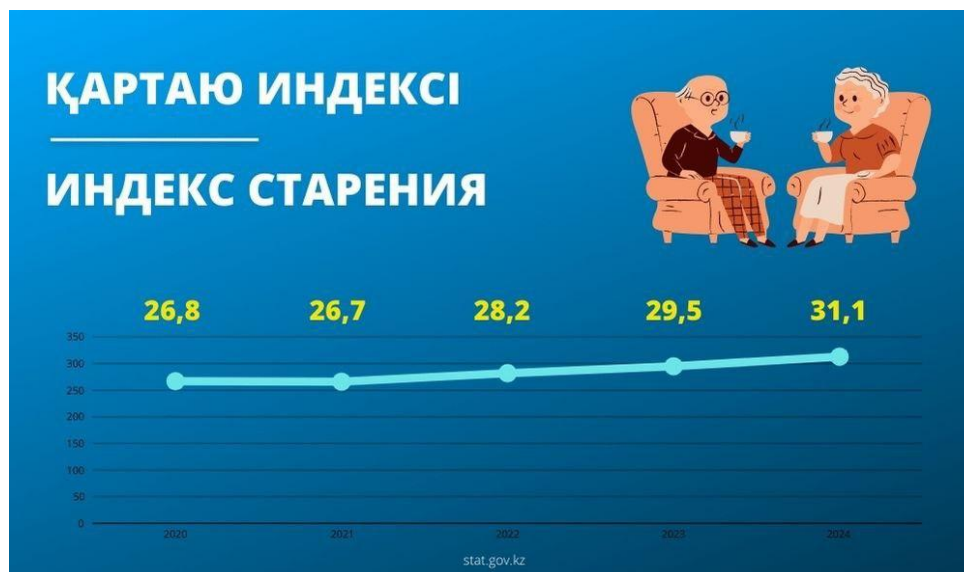
Диаграмма 2. Қазақстандағы халықтың қартаюу көрсеткіші [ https://stat.gov.kz/news/aza-standa-artayu-indeksi-bir-zhyl-ishinde-1-6-payyzydy-tarma-a-artty/ ].

Токионың 23 ауданында еңістерден зардап шеккен қарттардың саны артып келеді: «Биіктіктегі айырмашылық Тама аймағындағыдай үлкен болмаса да, Мусашино үстіртінің шетіндегі сияқты тік беткейлер өте көп. Сондай-ақ, жоғары деңгейлі тұрғын үй ауданы ретінде белгілі Дененчофуда (Ота Уорд) «саудаға қабілетсіз» адамдар бар. Әр аймақтың ерекшеліктеріне сәйкес келетін адамдарға қолдау көрсету әрекеттері бүкіл Токиоға таралуда» Nihon Keizai Shimbun 田園調布の坂道、高齢者ため息 買い物は宅配とタクシー。東京で老いる。東京で老いる。2025年2月27日 11:00 [会員限定記事].