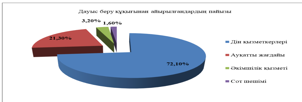
Диаграмма 2. Денисов уезінің болыстары бойынша сайлау құқығынан айырылған азаматтардың жалпы санындағы дін қызметкерлерінің пайыздық үлесі (1925 ж.) [ҚОМА, Қ.Р-72-қор, 1-тізбе, 360-іс, 1-8-п.].

1925 жылғы мәліметтер бойынша Денисов уезінде діни белгілеріне байланысты шектелгендердің саны 44 адамды құрап, жалпы шектелгендердің 72,1 пайызына тең болды (диаграмма 2). 2 диаграмма деректері бұл өңірде сайлау құқығынан айыру саясаты ең алдымен дін қызметкерлеріне бағытталғанын дәлелдейді.