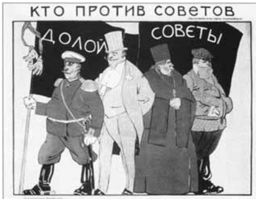
Сур. 1. Кеңестерден аулақ болу керек – жаулар (суретші Д.С. Моордың «Кеңеске қарсы кім?» плакаты, 1919 жыл)

Кеңес өкіметі үшін саяси тұрғыдан қауіпті деп танылған әлеуметтік топтардың ұжымдық бейнесі насихаттық материалдарда да көрсетілді. Мысалы, 1919 жылы суретші Дмитрий Моор (Орлов) жасаған «Кеңеске қарсы кім?» атты плакатта Кеңес билігіне қарсы әлеуметтік топтардың жинақталған бейнесі берілген (сур. 1).